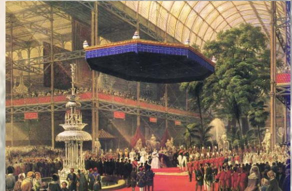
La reine Victoria inaugure l'Exposition Universelle le 1 er mai 1851 à Londres

C'est un publiciste peu connu, E.P. Hood, qui créa l'adjectif « victorien », en 1851, lors de l'Exposition Universelle de Londres. Le mot, non seulement, fut conservé dans la langue anglaise, mais passa dans toutes les langues d'Occident. Car le long règne de la reine Victoria (1837-1901) coïncida avec la plus grande période d'expansion de l'empire britannique et fut une période de changement économique, social et politique sans précédent.